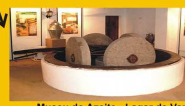
Museu do Azeite - Lagar de Varas