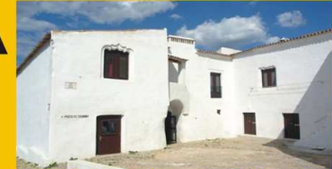
Pátio dos Rolins - Posto de Turismo