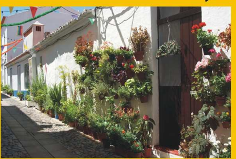
Rua das Janelas Floridas