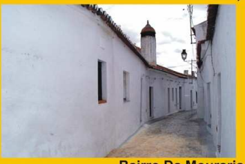
Bairro Da Mouraria