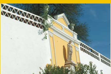
Bica de Stª Comba