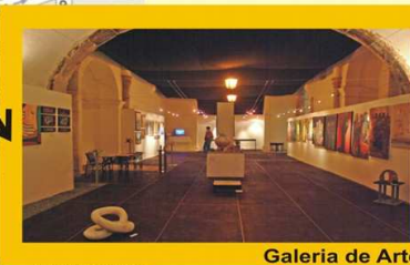
Galeria de Artes