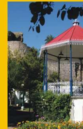
Jardin Dr. Santiago