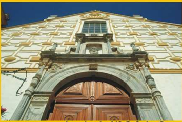
Igreja de Nª Srª do Carmo