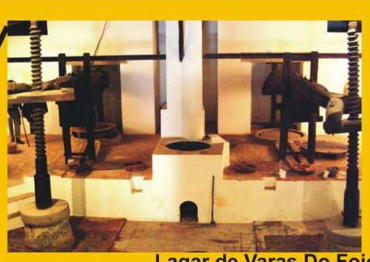
Lagar de Varas Do Fojo