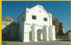
Igreja do Convento do Castelo