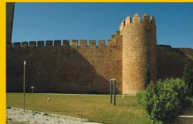
Zona do Castelo