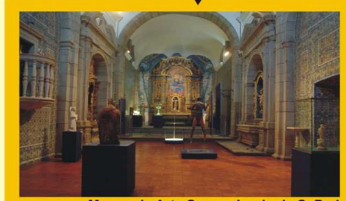
Museu de Arte Sacra - Igreja de S. Pedro